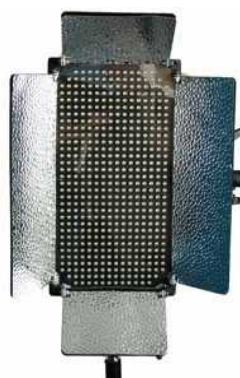
Mounts Horizontally or Vertically