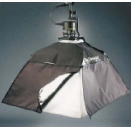
Photoflex White Dome