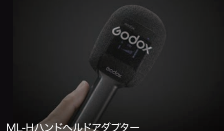
ML-Hハンドヘルドアダプター MoveLink II TX用

ML-Hアダプター(別売)により、MoveLinkはハンドヘルドマイクに変換できます。送信機をこのアダプターにスライドしてフォームを装着するだけ。インタビューなどに使用できる「マイク」を入手できます。